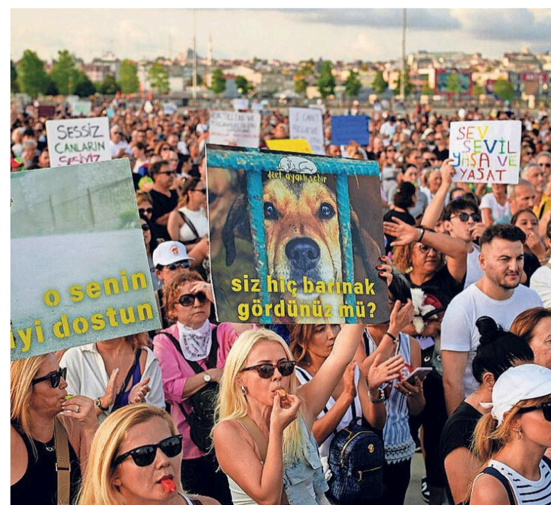
Protest in Turkije tegen de nieuwe wet.